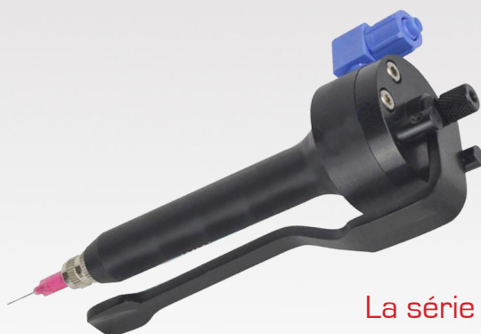
La série CA

Les valves de dosage CA sont des valves à diaphragme. Chaque valve est précisément usiné grâce des normes élevées en terme de qualité qui garantissent la fiabilité des opérations. Nos valves sont testés et breveté en laboratoire avant expédition.