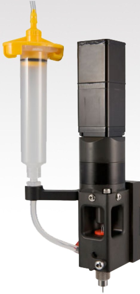
Valve à vis sans fin SVX

POLY DISPENSING SYSTEMS S Y S T E M E S D E D O S A G E I N D U S T R I E L