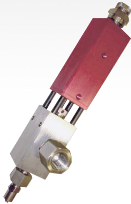
MV300 VALVE VOLUMÉTRIQUE

POLY DISPENSING SYSTEMS S Y S T E M E S D E D O S A G E I N D U S T R I E L