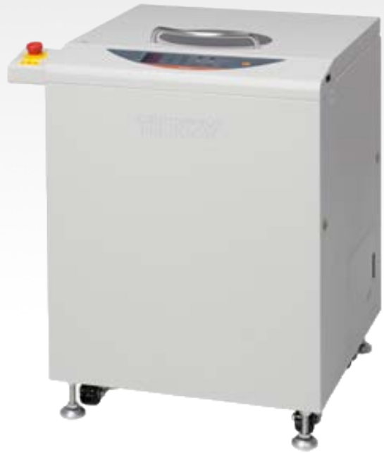
ARV 930-TWIN THINKY MIXER

POLY DISPENSING SYSTEMS S Y S T E M E S D E D O S A G E I N D U S T R I E L