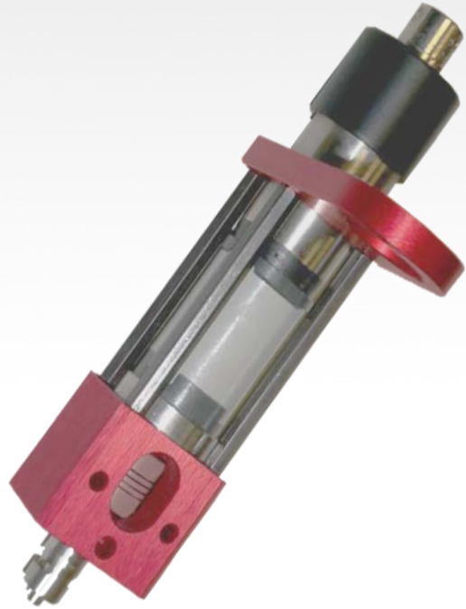
SV200 VALVE A VIS SANS FIN

POLY DISPENSING SYSTEMS S Y S T E M E S D E D O S A G E I N D U S T R I E L