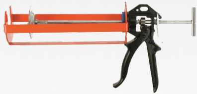
Serie ULTRAFLOW [ 3 modèles ]