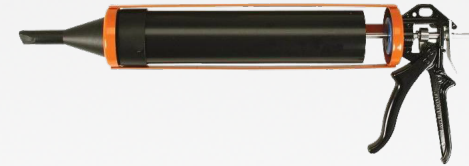
Serie ULTRAPOINT [ 1 modèle ]