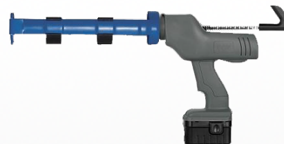
Serie ELECTRAFLOW [ 2 modèles ]