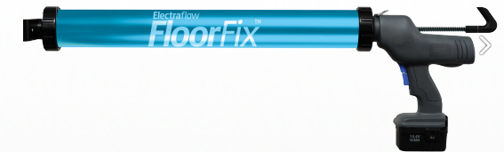
Serie WALLFIX [ 1 modèle ]