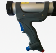
AIRFLOW III [ 4 modèles ]