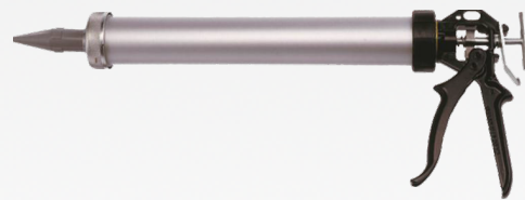
Serie Powerflow [ 6 modèles ]