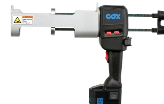
POWERPUSH 7000 MR