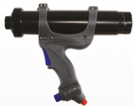
Serie JETFLOW [2 modèles]