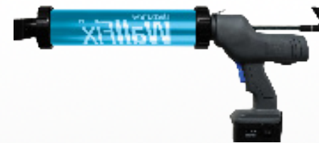
Serie FLOORFIX [ 1 modèle ]