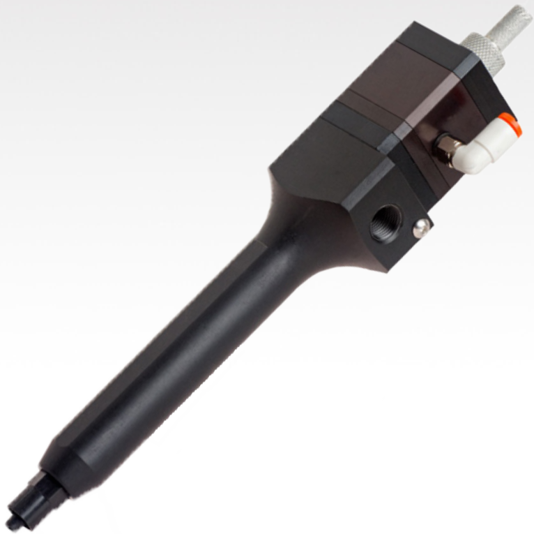
CAM300 Valve à diaphragme

POLY DISPENSING SYSTEMS S Y S T E M E S D E D O S A G E I N D U S T R I E L