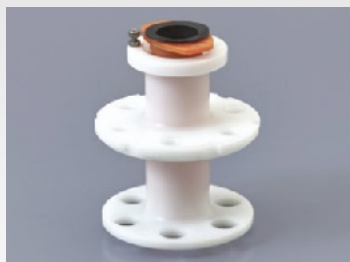
250AD-30S Pour les seringues de 20/30ml