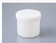
Pot de 250ml