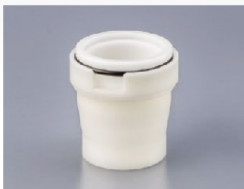
100AD-NAN-U Pour les Umano UG de 12ml, 24ml, 35ml