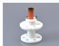
250AD-10S Pour les seringues de 10ml