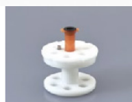
250AD-5S Pour les seringues de 5ml