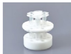
250AD-M3S x6 Pour les seringues Musashi 3ml x 6

* Toutes les seringues sur les images ci-dessus ne sont pas incluses