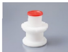
250AD-100BS Pour les barils de 100ml