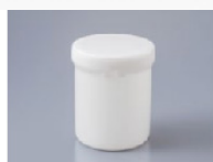
Pot de 360ml