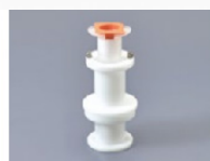
100AD-30S Pour les seringues de 20/30ml