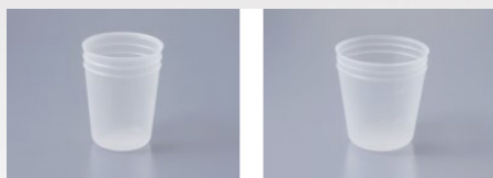
Pot jetable de 100ml