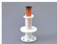
250AS-50S Pour les seringues de 50ml