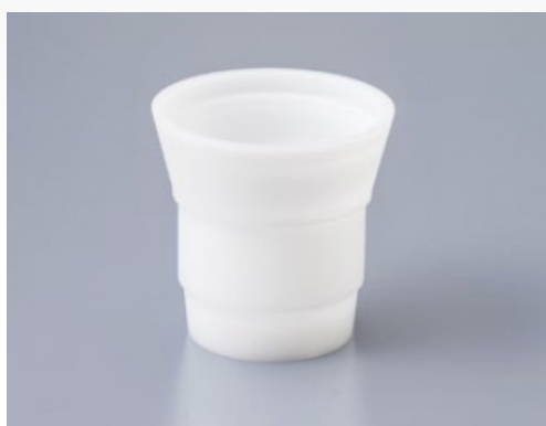
50AD-NAN-U Pour les Umano UG de 58ml