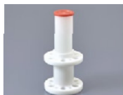
500AD-170B Pour les barils de 170ml