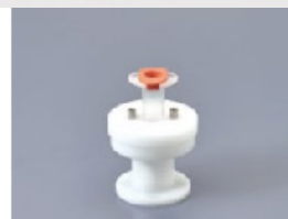
100AD-5S Pour les seringues de 5ml