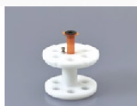
250AD-3S Pour les seringues de 3ml