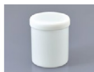
Pot de 750ml