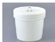
Pot de 4000ml