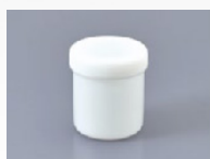
Pot de 150ml