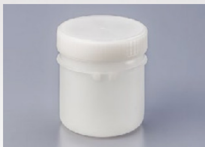
Pot de 300ml