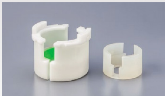
250AD-NAN-U Pour les Umano UG de 12ml, 24ml, 35ml, 58ml, 125ml