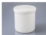
Pot de 1000ml