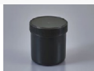
Pot anti-UV de 300ml