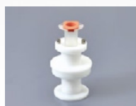
100AD-10S Pour les seringues de 10ml