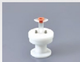
100AD-3S Pour les seringues de 3ml