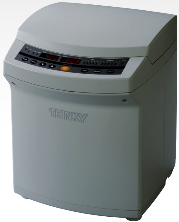
SR 500 THINKKY MIXER