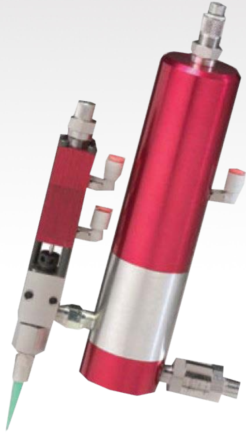
MV400 VALVE VOLUMÉTRIQUE

POLY DISPENSING SYSTEMS S Y S T E M E S D E D O S A G E I N D U S T R I E L